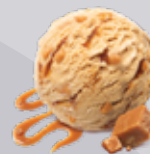
Caramel Beurre Salé