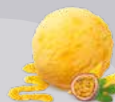
Fruits de la Passion