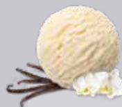
Vanille Bourbon de Madagascar